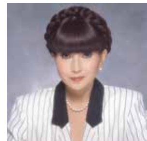
ジャイアントパンダ保護サポート基金運営委員会顧問

※ 竹や笹のなかまは、60 年～120 年に一度花が咲き、一斉に枯れるといわれています。