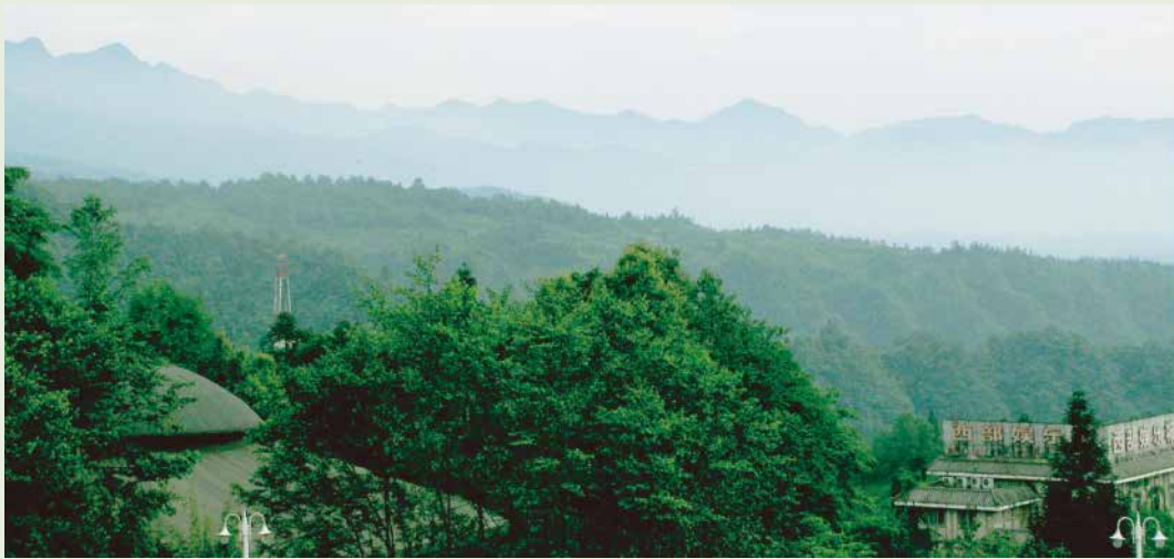
野生のジャイアントパンダが生息する四川省の山

そして上野動物園では、園内に広告を掲示することにより民間の企業から協賛を募り、この資金を活用し、「ジャイアントパンダ保護サポート基金」を推進していきたいと考えています。