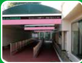
② 園内ボードセット