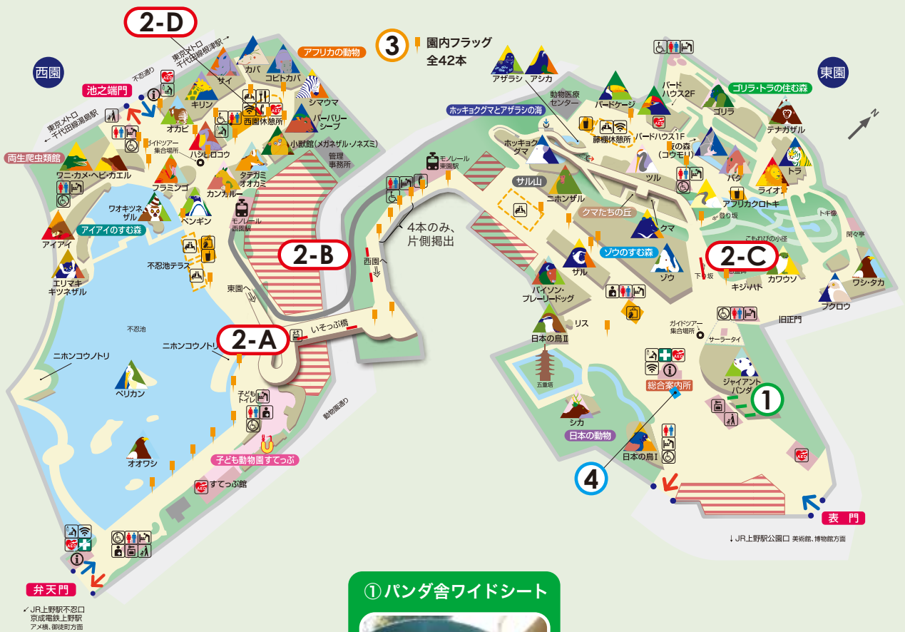
① パンダ舎ワイドシート