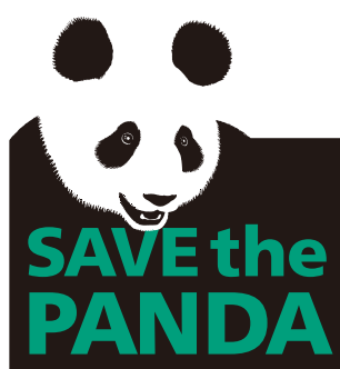
ジャイアントパンダ保護サポート基金

ジャイアントパンダ保護サポート基金のオフィシャルロゴマークを入れた商品、印刷物等の作成にご使用いただけます。