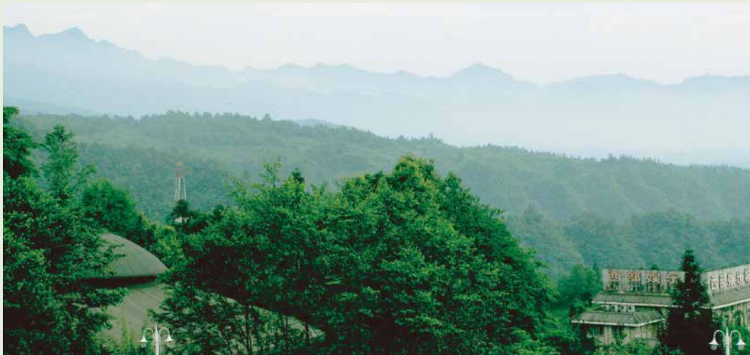
野生のジャイアントパンダが生息する四川省の山

そして上野動物園では、園内に広告を掲示することにより民間の企業から協賛を募り、この資金を活用し、「ジャイアントパンダ保護サポート基金」を推進していきたいと考えています。