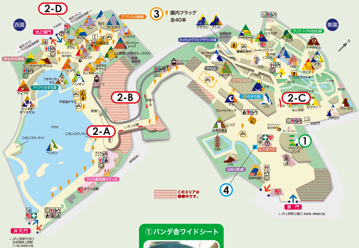
① パンダ舎ワイドシート