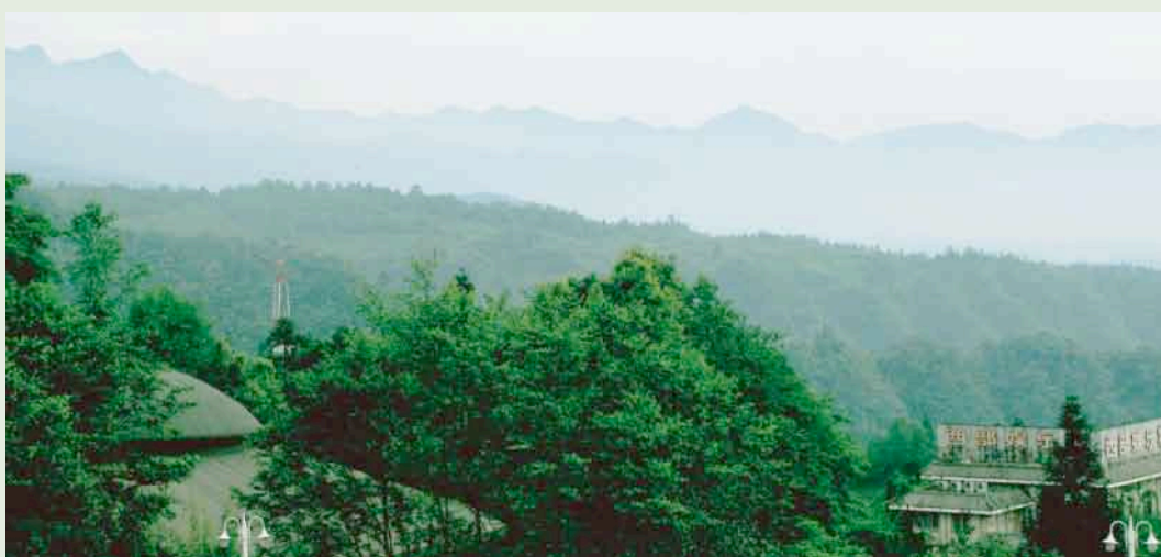
野生のジャイアントパンダが生息する四川省の山

そして上野動物園では、園内に広告を掲示することにより民間の企業から協賛を募り、この資金を活用し、「ジャイアントパンダ保護サポート基金」を推進していきたいと考えています。