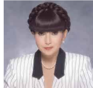
ジャイアントパンダ保護サポート基金運営委員会顧問

※ 竹や笹のなかまは、60～120年に一度花が咲き、一斉に枯れるといわれています。